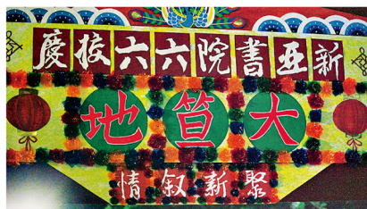
學生籌委為大笪地會場製作的花牌。