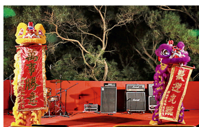
新亞國術會於千人宴上表演舞獅。

本年新亞書院院慶主題為「聚新·敘情」，活動主要包括開幕禮、千人宴、敬師活動、大笪地和健步跑暨成功慈善步行日，一連串活動凝聚不同年代的新亞人，讓新亞精神承傳不斷。