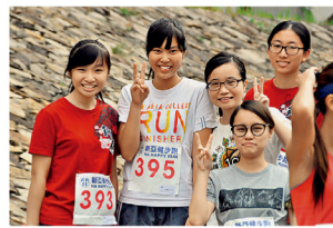
參加健步跑的健兒。