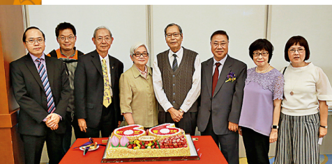
校友、大學及書院教職員一同分享院慶大蛋糕。