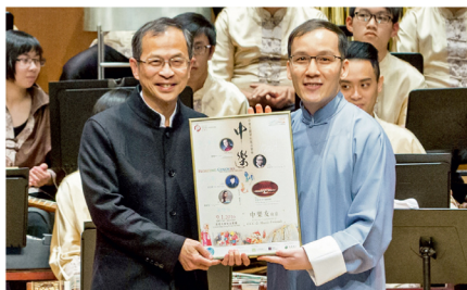
趙慶中向當晚主禮嘉賓立法會主席曾鈺成(左)致送紀念品。