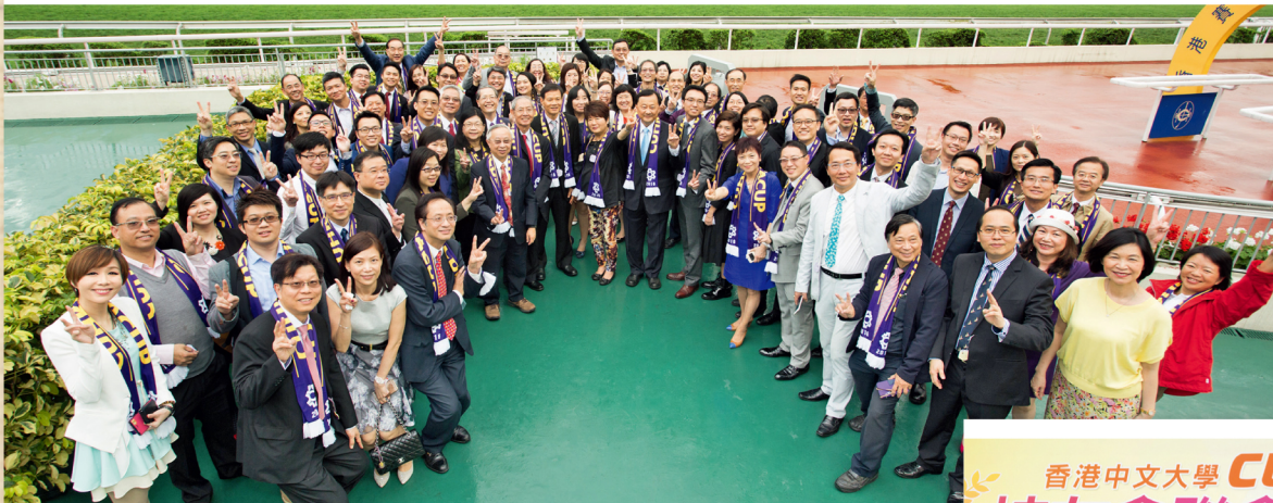
校友會聯會盃賽馬於4月10日在沙田馬場順利舉行，逾二百位校友和嘉賓出席。活動主禮嘉賓華雲生副校長與一眾嘉賓於聯會盃賽事後與一眾校友合照留念。