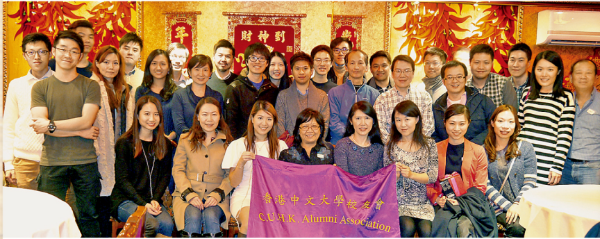
1月31日校友會舉辦了迎猴團年聚會，約四十位校友親友和交換生參加。眾人相聚過年，享用應節美食。