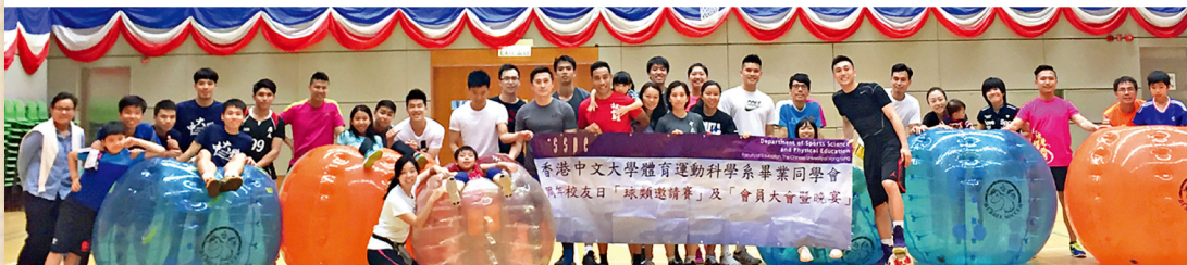
同學會於4月16日舉行校友日，校友們先在楊明標體育館作籃球比賽，再進行時下流行的泡泡足球大賽。當晚眾校友與教授於崇基學院眾志堂一同晚宴。