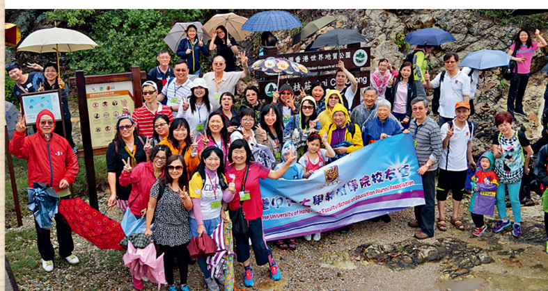
校友會並為此行作聯兩則，一曰：「迢迢江海迎新綠，絮絮桑麻話舊情」，另一曰：「驕陽乍去雷轟苑，暴雨急來風動船」。

校友會於4月24日舉辦春遊活動，聯同港大教院校友會的同儕共七十五人參加。當日行程包括在海底灣欣賞珊瑚、在塔門觀奇石兼嚐風味宴，以及在荔枝窩觀賞摺曲地貌。