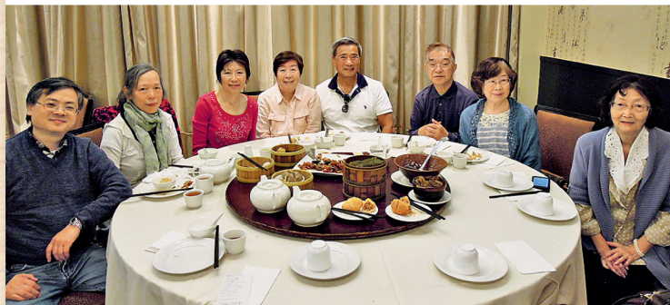
校友會於5月1日舉辦春日郊遊及點心茶敘，校友相聚談天，言談甚歡。