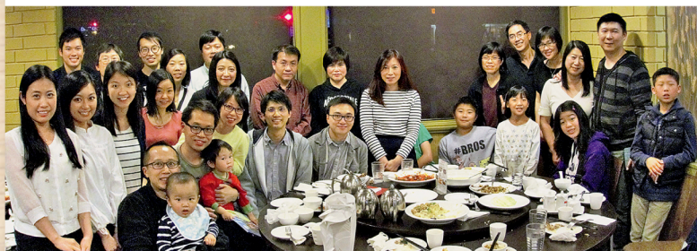
校友會於2月27日舉行丙申年春宴，宴會取址港式餐廳，以解一眾校友的思鄉之情。