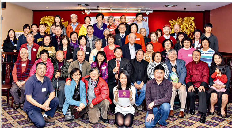
校友會於2月28日舉行新春晚宴，與各校友親朋歡聚一堂，盡興而歸。