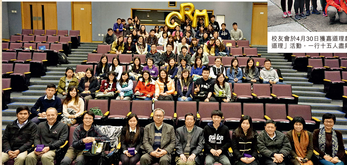
校友會於3月16日與地理學系及系會合辦2015職業講座，安排三位年青校友及其他學長為系內應屆畢業生分享職場見聞。