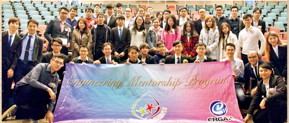
校友會於1月30日舉行第三屆「工程師友化」學長計劃開幕禮，獲多位校友參與，跟同學分享交流。