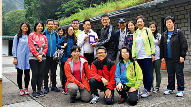
校友會於4月30日獲嘉道理農場暨植物園接待，舉行「夜遊嘉道理」活動，一行十五人盡興而歸。