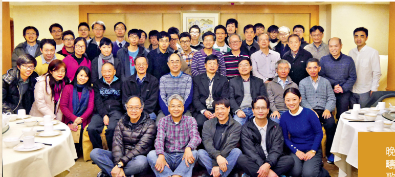
校友會於3月12日舉行第一次會員大會暨周年晚宴，共敘同誼。