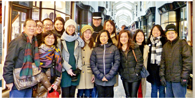
校友會亦於2月20日及27日分別舉行羽毛球同樂日和遊覽伯靈頓拱廊商場兩項活動。圖為校友於伯靈頓拱廊商場合照留影，該商場有近二百年歷史，是世界上最早的拱廊商場之一。