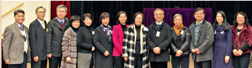
校友會於3月12日舉行「2016中小幼課程銜接經驗分享會『探究學習新世代：從常識到通識』」，邀得中大教育學院楊秀珠教授及吳本韓博士，以及教育局總課程發展主任戴偉森作專題分享。當日有一百位校長及老師參與，為中小幼教師的經驗交流提供良好平台。

🌐 : www.alumni.cuhk.edu.hk/aashaa/ ✉ : aa-shaa@alumni.cuhk.edu.hk