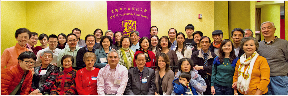
校友會於3月5日舉行新春團拜，約有四十位校友出席，場面熱鬧。