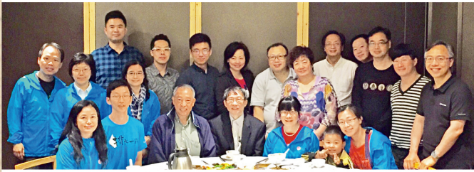
校友會2016年會員大會於4月16日舉行，席間通過去年度會務報告。