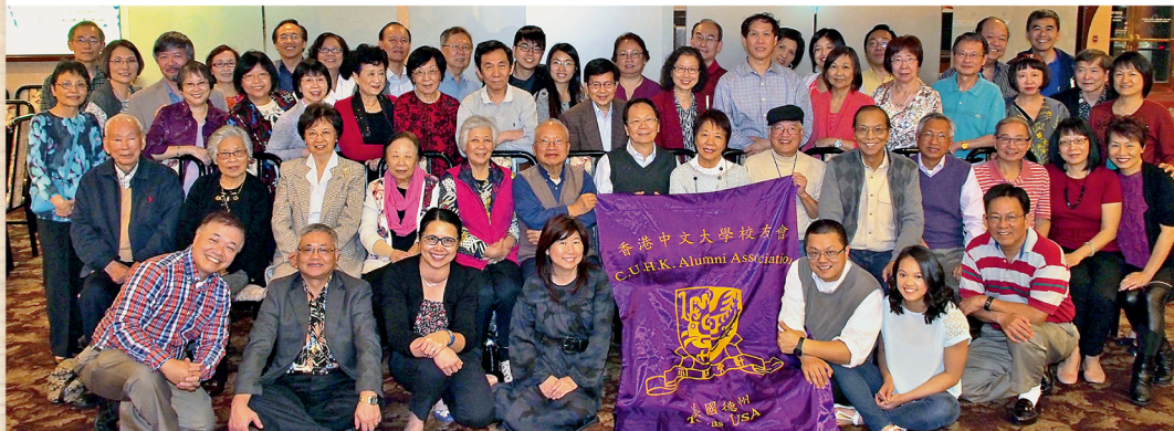
校友會於3月舉辦農曆新年聚會，有逾五十名校友及親友參與。