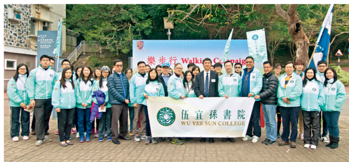
伍宜孫書院員生聚集在「樂步行2016」之起步點港鐵大學站。