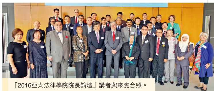
「2016亞太法律學院院長論壇」講者與來賓合照。