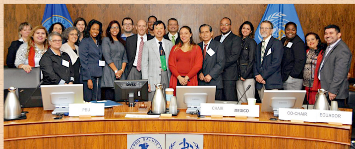
蔡校友(前排中，綠夾者)與泛美衛生組織策略計劃顧問小組成員於4月5日在組織的美國華盛頓總部合照。

蔡校友的加入有助促進加拿大與泛美衛生組織的關係，彰顯加拿大在美洲的領導以至提升該國的國際地位。他在PAHO策略計劃顧問小組擔任加國代表及技術主管，協助組織修訂2014-2019策略計劃中關於影響和成效的指標，以及開發一套能可靠地確定科研項目優先次序的方法。