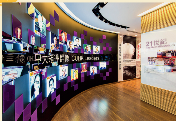
「筆路藍縷—創校歷程」展區

展覽廳於2013年開幕，以誌中大金禧校慶。共兩層的展覽廳分為七大展區，包括筆路藍縷—創校歷程、中國研究、口談實錄等，展出數百幀珍貴的歷史照片、文物及多媒體資源，涵蓋中大逾半個世紀的發展及成就。