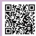
Alumni ID 校友編號查詢