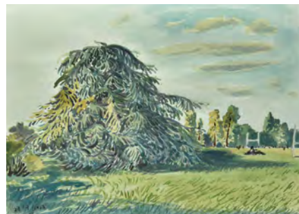
▲ Stephen 首訪牛津，隨身帶着畫具記錄當地的人文風景。（2023）

把一個醞釀已久關於麥理浩徑系列的計劃付諸實行，「那時剛好有拍賣行想找我合作一個展覽，我提出這構思。我花半年時間走畢全長 100 公里共 10 段的麥理浩徑，現場畫的是速寫，回到工作室再憑記憶和幻想重