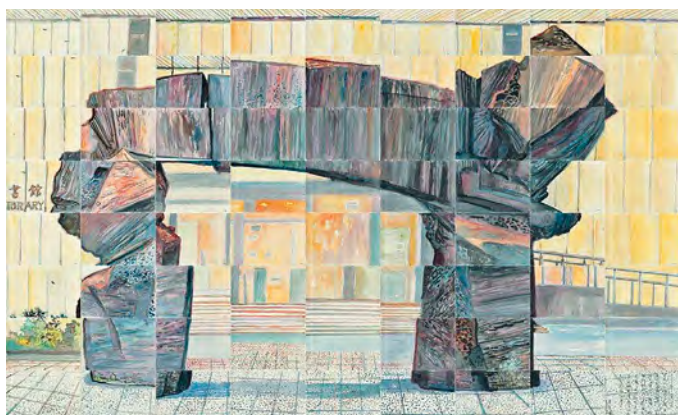
▲ 他以 72 張畫紙，從不同視角細緻繪畫仲門的美態。(2023)