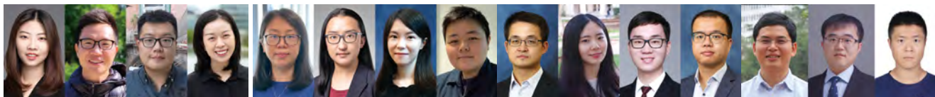
▲（左起）竇琪教授、馮剛毅教授、吳震宇教授及王海天教授