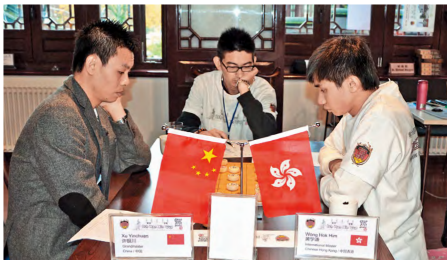
▲ 2014年 Himson（右）在第六屆「淮陰·韓信盃」象棋國際名人賽，戰勝當年稱霸內地象棋界的許銀川（左），成為最難忘的一戰。

Himson 早已榮升象棋國際特級大師，五屆全港冠軍，香港排名第一，曾奪 2019 年世界賽亞軍，創香港史上最佳成績，對於在象棋路途未來能走多遠，他說不會設限，只求尋