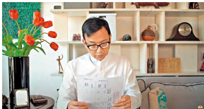
▲ 拍片前的準備功夫最花時間，劉校友說開拍前會再三熟讀稿件，以防說錯。