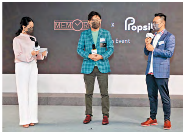
▲ 去年 12 月他（右一）與港產陀飛輪鐘錶品牌萬希泉合作，把師傅組裝陀飛輪腕表的獨家珍貴片段製成 NFT。