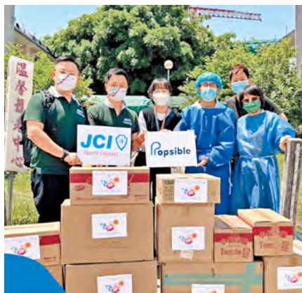
▲ Popsible 與北區青年商會聯合鑄造 50 個 NFTs 慈善售賣，善款用作購買防疫物資，送給基層及老人院。