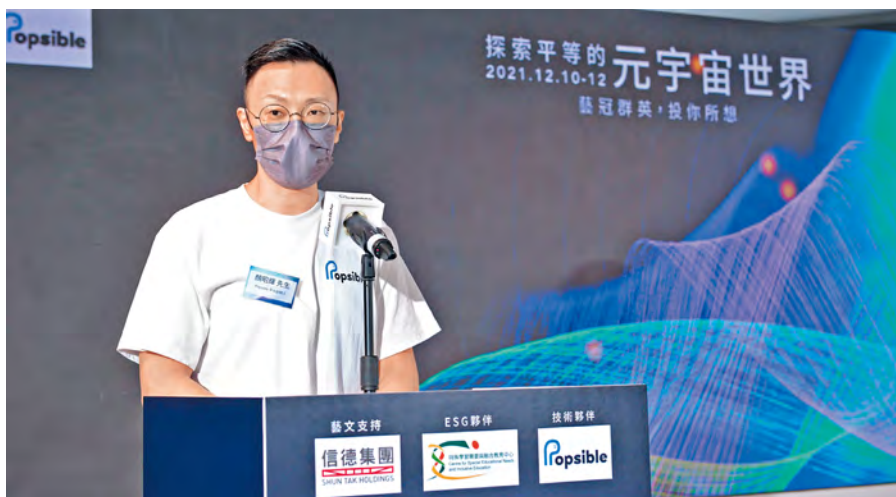
▲ 顏校友出席各大小講座，向市民大眾講解 NFT 背後理論，希望能讓更多人參與。