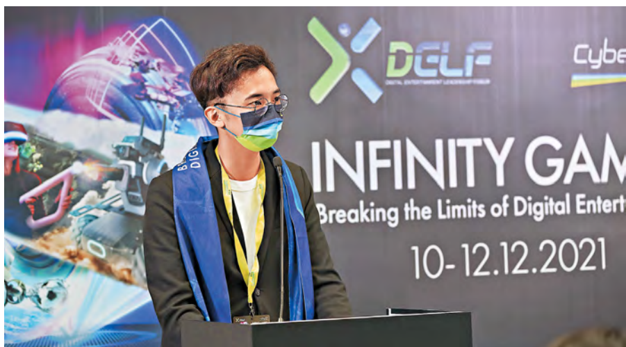
▲ 去年出席數碼港數碼娛樂領袖論壇，講解人工智能與文字創作的關係。