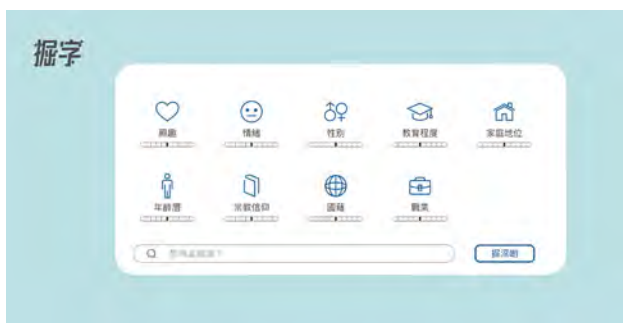
▲ 系統為用戶從九大範疇設定角色，由此創作對白。

作坊，鼓勵學生從事電影創作，除非有團體或機構要求特別的數據庫，才會額外收費，收費形式也要雙方商討後才能決定。談及收回成本，Kelvin 表示仍會專注於粵語市場，「英語系